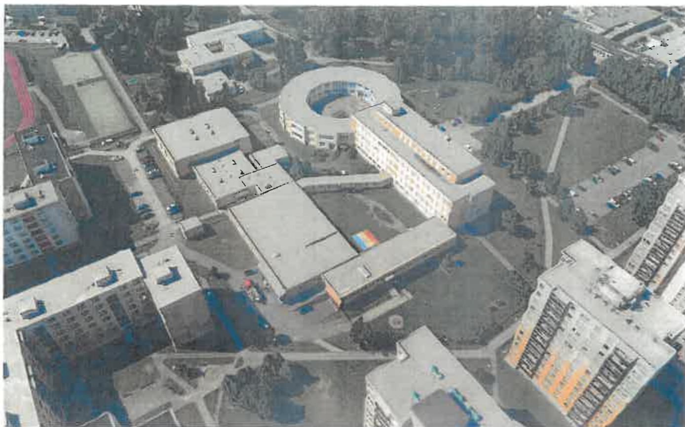
REKONSTRUKCE VZT - KUCHYNĚ, JÍDELNA, SKLADY KUCHYNĚ ZÁKLADNÍ ŠKOLA PALACHOVA 2189/35, ŽDÁR NAD SÁZAVOU, 5.ZŠ